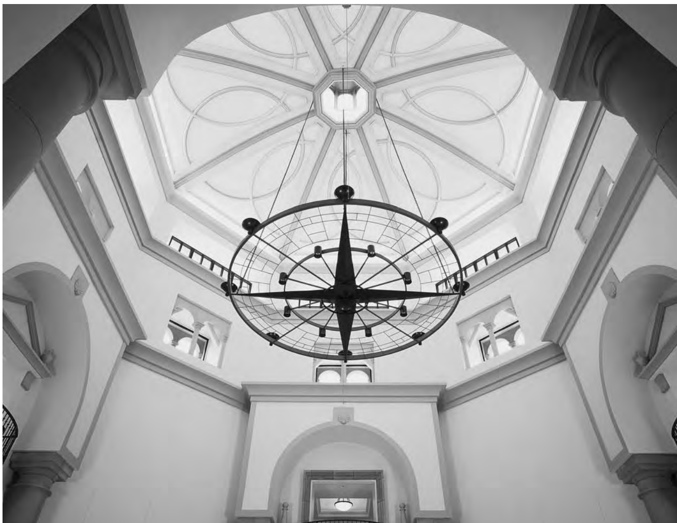
Instituto para la Paz y la Justicia Joan B. Kroc

3:30 – 4 p.m. Salida del Autobús (se informarán los detalles)