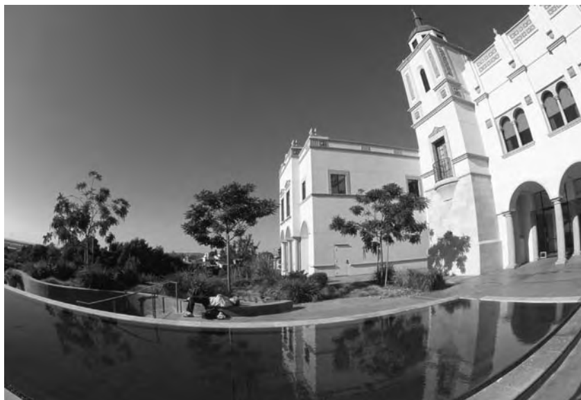
IPJ Reflection Pool